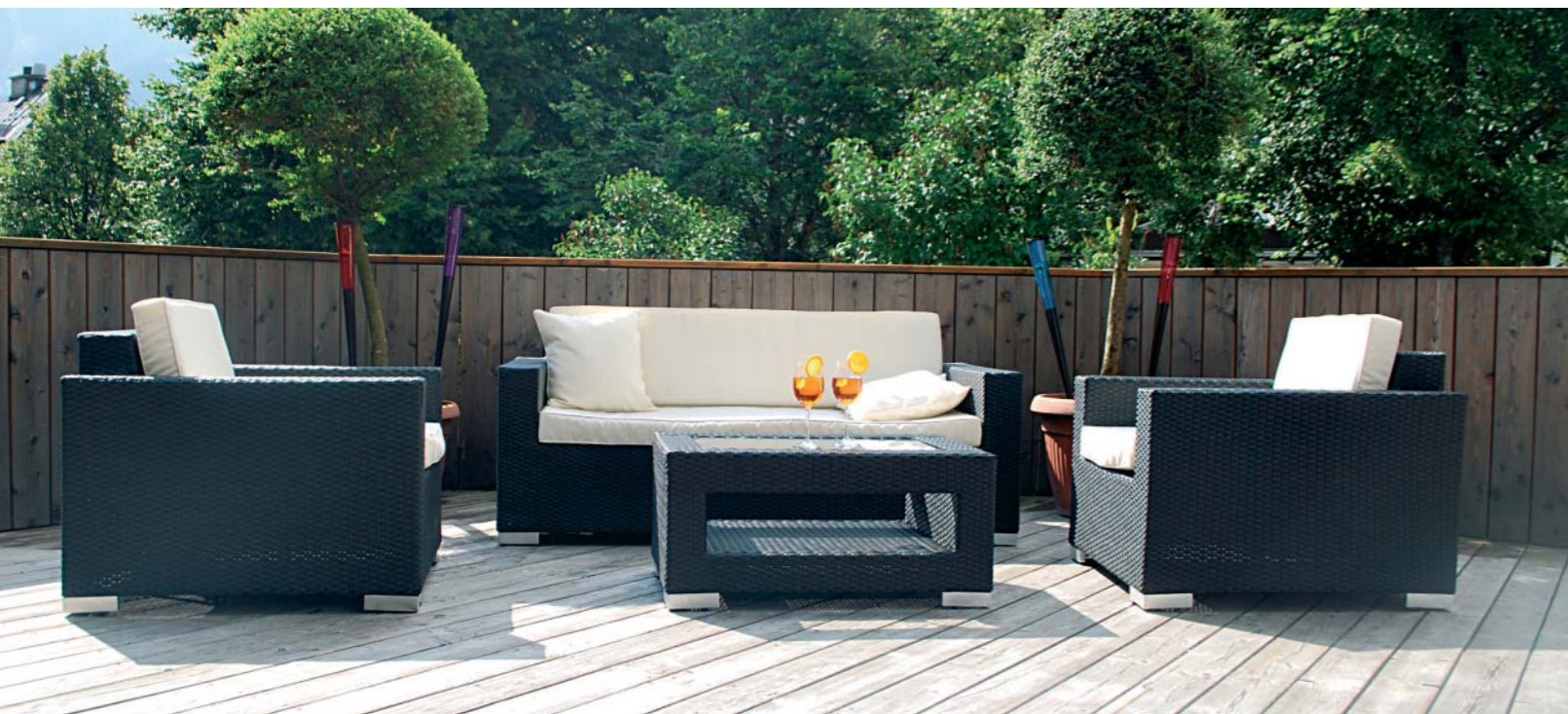
Abschalten und genießen am neuen Sonnendeck im Steinerwirt!