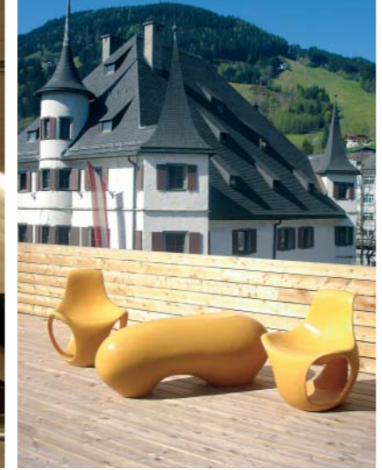
Über den Dächern der Bergstadt thront die Steinerwirt-Terrasse.