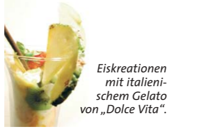
Eiskreationen mit italienischem Gelato von „Dolce Vita“.