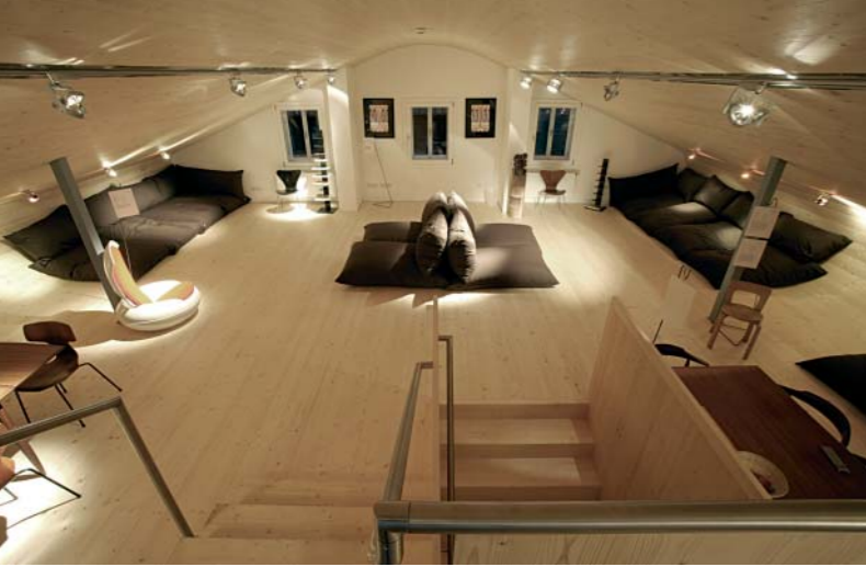
Der „Think Tank“ - perfekt für kleine Seminare und Feiern - wurde mit dem Holzbaupreis 2007 ausgezeichnet.