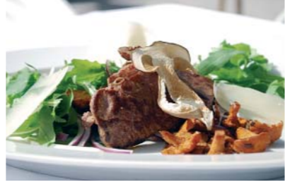
So schmeckt der Sommer im Steinerwirt.